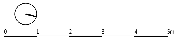
RZUT POZIOMU 1